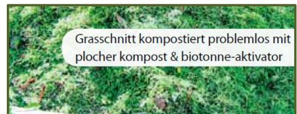
Grasschnitt kompostiert problemlos mit plocher kompost & biotonne-aktivator

Um das Edaphon (das im Boden Lebende) zu aktivieren, welches letzten Endes für das Bodengefüge zuständig ist, wird das Produkt plocher humusboden eingesetzt. Damit behandeln Sie die Ursachen!