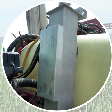
plocher agro-kat für die Feldspritze bis ca. 3000 l

Quellwasserstruktur für den Boden und die Pflanzen über die Feldspritze: