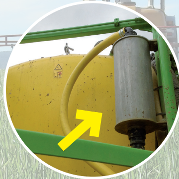
plocher agro-kat xl für die Feldspritze ab ca. 3000 l

Einfachere und schnellere Spritzenreinigung - da weniger Ablagerungen in den Leitungen und Filtern!